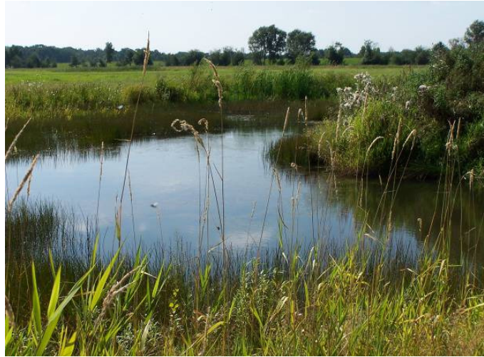
Seegeniederung bei Gartow (K.-J. Steinhoff)