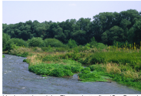
Hochstaudenreiche Flussschotterflur (O.v.Drachenfels)