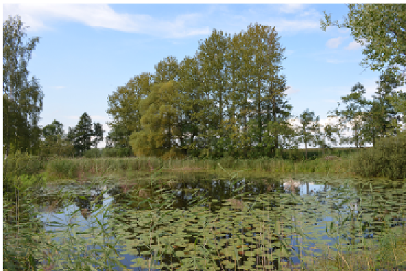
Kaarßener See

angeboten. Anträge hierzu sind ebenfalls beim Niedersächsischen Landesbetrieb für Wasserwirtschaft, Küsten- und Naturschutz zu stellen.