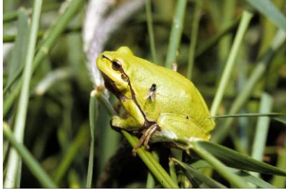
Laubfrosch (R. Podlucky)

Die Biotoypenausprägungen des Feuchtgrünlandes und der Niedermoore kommen allerdings nicht nur in der morphologischen Aue vor, sondern sind in Teilen auch außerhalb anzutreffen. Schwerpunkträume von Feuchtgrünland und Niedermoor jenseits der Auen wurden deshalb in der Programmkulisse mit aufgenommen.