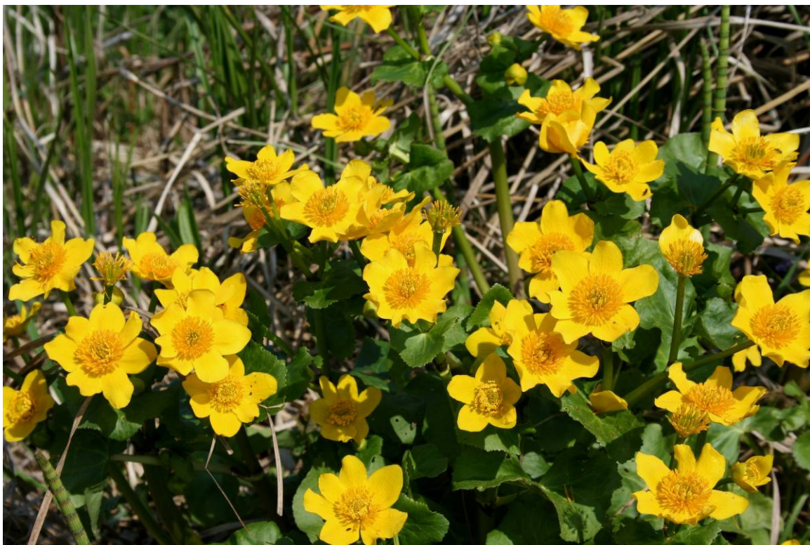
Sumpfdotterblume (O. Schwarzzer)

Niedersachsen trägt eine besondere Verantwortung für den Erhalt der Niedermoore, da sich deren Schwerpunkträume in Deutschland fast ausschließlich in der norddeutschen Tiefebene befinden. Etwa vier Prozent (ca. 182.000 Hektar) unserer Landesfläche sind dem Landschaftstyp ‚Niedermoor‘ zuzuordnen. Wesentliche Faktoren für die Moorbildung sind der ausgeprägte Wasserhaushalt in Verbindung mit der Ablagerung unzersetzter organischer Pflanzenmasse (Bruchwald- und Seggentorfe), wodurch über lange Zeiträume unterschiedlich starke Torfkörper gebildet werden. Von Niedermooren spricht man, wenn Torfmächtigkeiten von mindestens 30 cm auftreten und der Boden mindestens 30 % Anteile unzersetzter Pflanzenreste enthält.