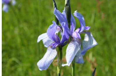
Sibirische Schwertlilie (O. Schwarzer)