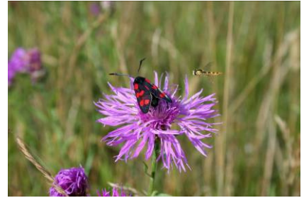
Widderchen (O. Schwarzer)