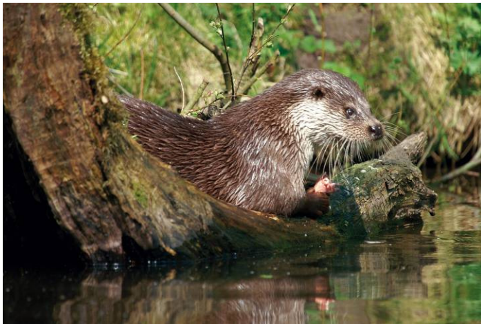
Fischotter im naturnahen Bach (Aktion Fischotterschutz)

Nach dem Niedersächsischen Wassergesetz ( www.nds-voris.de ) werden die oberirdischen Gewässer nach ihrer wasserwirtschaftlichen Bedeutung in drei Ordnungen eingeteilt. Gewässer erster Ordnung repräsentieren in der Regel die größeren schiffbaren Binnenwasserstraßen, während es sich bei der zweiten Ordnung um Gewässer von überörtlicher Bedeutung handelt, die sich in der Zuständigkeit eines Unterhaltungsverbandes befinden. Gewässer dritter Ordnung sind meistens Gräben von örtlicher Bedeutung. Gemäß dieser Hierarchie beinhaltet die landesweite Gebietskulisse des Auenprogramms nur Gewässer erster und zweiter Ordnung.