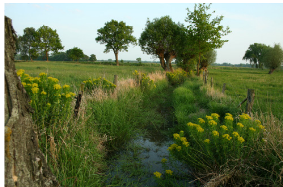
Graben mit Sumpfwolfsmilch (O. Schwarzzer)