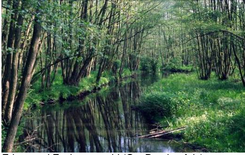
Erlen- und Eschenauwald (O.v.Drachenfels)