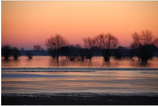
Jeetzelniederung (T. Keienburg)