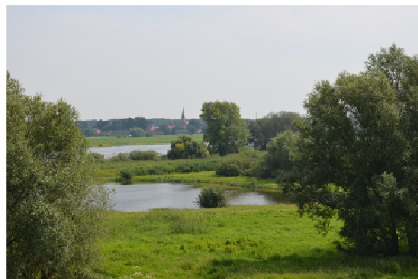
Elbauen mit Vorlandgewässer (A. Spiegel)