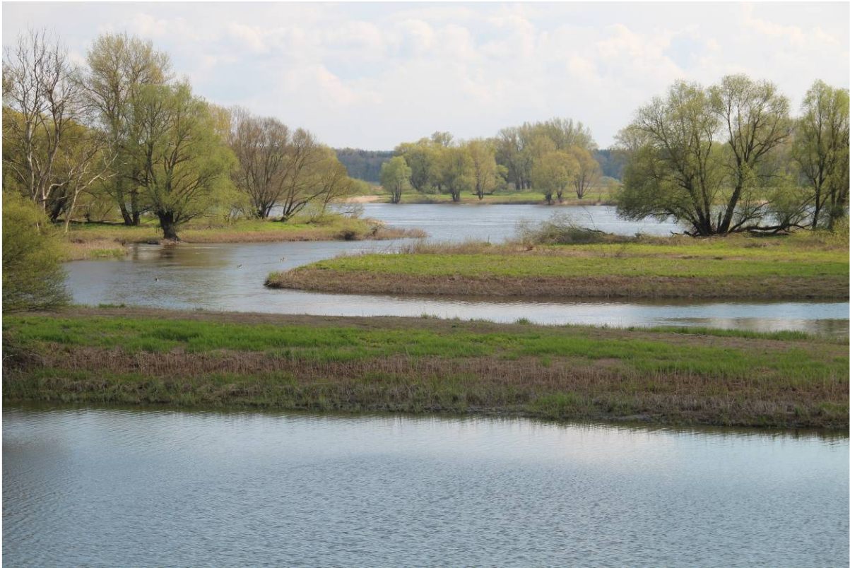
Auenlandschaft bei Stiepelse (T. Keienburg)