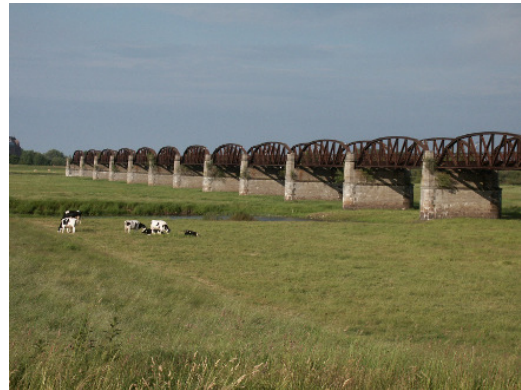
Kulturdenkmal Dömitzer Eisenbahnflutbrücke (O. Schwarzer)