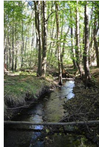
Bach am Geesthang (O. Schwarzer)

Des Weiteren haben folgende Kriterien die Ausprägung der Programmkulisse mitbestimmt: