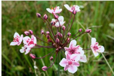
Schwanenblume (O. Schwarzer)

Veränderungen an Gewässern – z. B. auch zum Zwecke der Renaturierung – bedürfen in der Regel vor ihrer Durchführung einer wasserrechtlichen Genehmigung durch die zuständige Wasserbehörde; das NWG vom 19.02.2010 bietet hierfür die gesetzliche Grundlage.