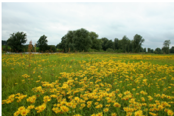
Wiesenalant (O. Schwarzzer)

g = Bindung an grundwasserabhängigen Lebensraum