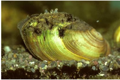
Teichmuschel (R. Altmüller)