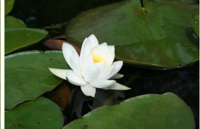
Seerose (O. Schwarzer)