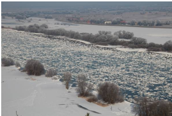
Elbe mit Eisgang (T. Keienburg)