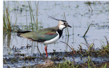
Kiebitz (T. Krüger)