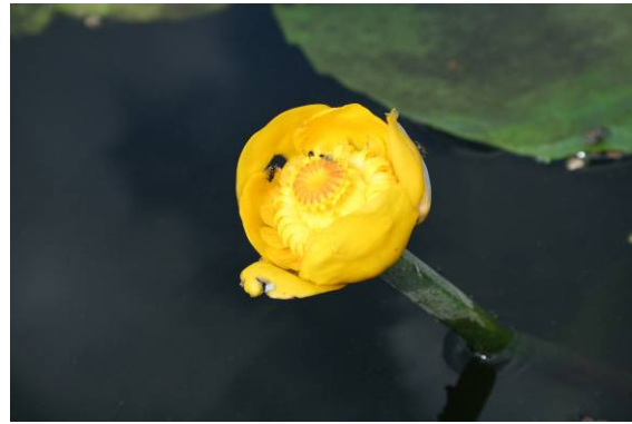
Teichrose (O. Schwarzer)