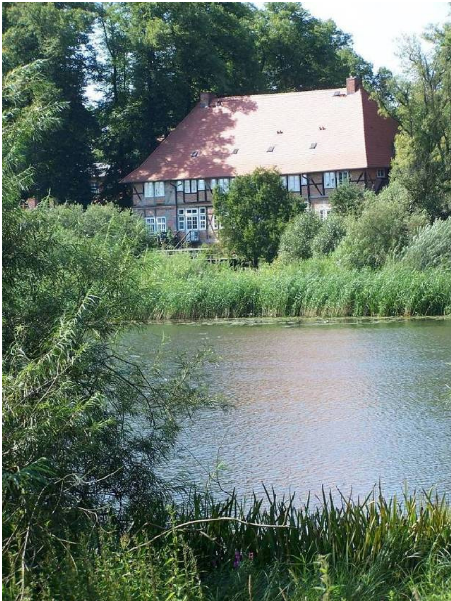
Kleiner Gartower See

Das bisherige Fischotterprogramm, Weißstorchprogramm, Feuchtgrünlandprogramm und das Fließgewässerprogramm – soweit es von der Niedersächsischen Naturschutzverwaltung umzusetzen war, werden künftig im Rahmen des Niedersächsischen Auenprogramms umgesetzt. Sie laufen zum 31.12.2012 als eigenständige Programme aus.