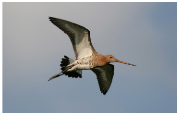
Uferschnepfe (T. Krüger)

Feuchtgrünland bietet neben seltenen Gräsern und Kräutern auch einem breiten Spektrum von z. T. sehr spezialisierten Tierarten den für sie erforderlichen Lebensraum. So sind insbesondere Wiesenvögel auf die übersichtlichen, gehölzfreien Feuchtgrünlandareale angewiesen, um diese als Brut- und Nahrungsplätze zu nutzen. Die in Niedersachsen für den Naturschutz wichtigen Schwerpunkträume haben unterschiedliche Ausdehnungen; in der Summe umfassen sie ca. 64.000 Hektar landesweit. Fördermaßnahmen sollen sich künftig auf den Erhalt folgender Lebensraumtypen konzentrieren: Pfeifengraswiesen, Brenndoldenwiesen, Magere Flachland-Mähwiesen sowie Artenreiches Nass- und Feuchtgrünland. Zum Erhalt der Wiesenvogelpopulationen muss Feuchtgrünland großräumig extensiv bewirtschaftet werden.