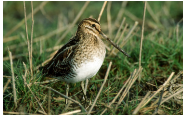
Bekassine (G. Reichert)