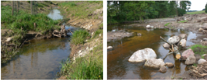
Beispiel zur Einbringung von Habitatalementen (li) Wurzelstubben; (re) Störsteine und befestigte Baumstämme (MK3)

Optimierung der Sohl- und Uferstrukturen (MK 3): Wenn über den gesetzlich vorgeschriebenen Gewässerrandstreifen hinaus keine Flächen zur Verfügung stehen, sind strukturverbessernde Maßnahmen in diesem Streifen vorzusehen. Dazu können Gehölzentwicklung, Ersatz von Uferverbau durch ingenieurbioologische Methoden und Totholzeinbau gehören.