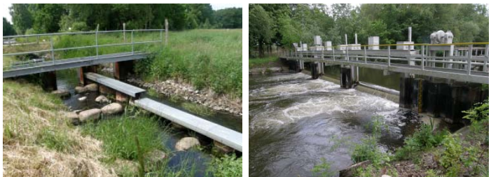
Wehr mit integrierter Fischaufstiegsanlage im Rottstocker Kanal (li); Wehr Blankensee ohne Möglichkeit für Fische auf- oder abzuwandern (re)

Nahezu die Hälfte der aufgenommenen Bauwerke in den Gewässern, stellt ein Wanderhindernis für Fische und die Wirbellose dar. Lediglich ein Fünftel der Bauwerke ist durchgängig, alle übrigen Bauwerke sind nur eingeschränkt passierbar.