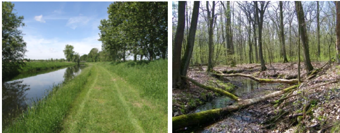
Nieplitz unterhalb von Beelitz- Gewässerstruktur 4 (li); Nieplitz im Bereich Bardenitzer Heide - Gewässerstruktur 1 (re)

Die Nieplitz und die einmündenden Gewässer sind nicht in einem guten ökologischen Zustand. Über 60 % aller Wasserkörper haben keine gute Gewässerstruktur.